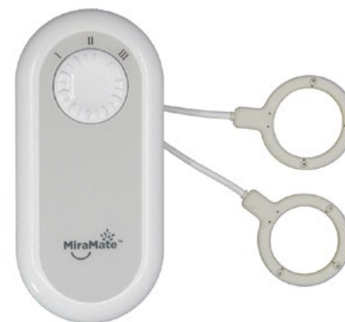
MiraMate Mini Magic

MiraMate Mini Magic est un appareil PEMF compact et portable qui peut réduire efficacement la douleur aiguë et l'inconfort n'importe où et n'importe quand.