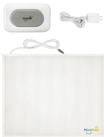
MiraMate Big Magic

Avec le grand tapis PEMF, Big Magic peut couvrir une surface considérable, ce qui vous permet de le placer sur votre chaise ou votre lit et de vous y asseoir ou de vous y allonger. Ce tapis est particulièrement utile pour les personnes qui souffrent d'inconfort au niveau du dos, des jambes ou des hanches.